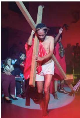
O espetáculo que será apresentado no bairro do Cristo Redentor, foi produzido pela Companhia de Artes Shamah e conta com uma banda que será responsável pela trilha sonora de cada cena.