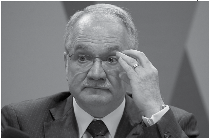
Ministro Edson Fachin, do Supremo Tribunal Federal (STF), autorizou a abertura de mais 76 inquéritos ligados à Operação Lava Jato